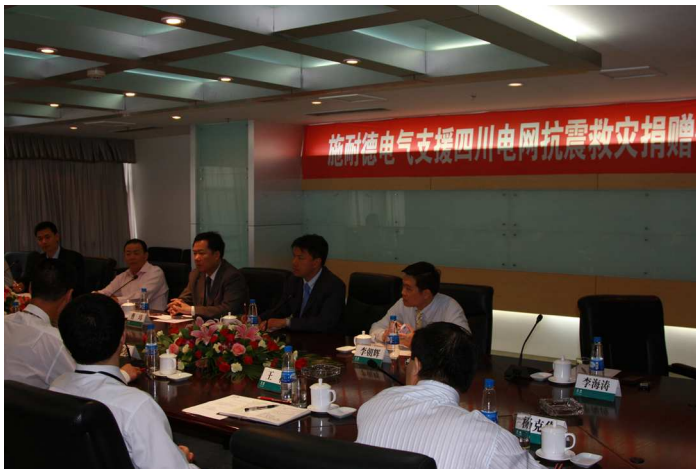
Juillet 2008, Schneider Electric effectue un don en matériel d'un montant équivalent à 1 million de yuan RMB à la province de Sichuan.

Chaque entité géographique de Schneider Electric a choisi indépendamment l'organisme bénéficiaire