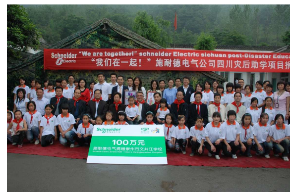
Cérémonie à l'école primaire de Wenjingjiang, où Schneider Electric aide à la mise en place d'équipements spécifiques pour soutenir différentes activités éducatives.

Les collaborateurs de Chine, Colombie, Espagne, France, Inde, Japon, Pays-Bas, Roumanie, Suisse, Taïwan... ont participé aux actions de reconstruction menées par Schneider Electric au bénéfice de la population de la province de Sichuan.