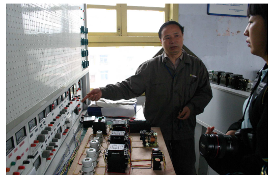
Un enseignant du centre de formation de Mingshan, où Schneider Electric soutient la mise en place d'un nouveau laboratoire technique.